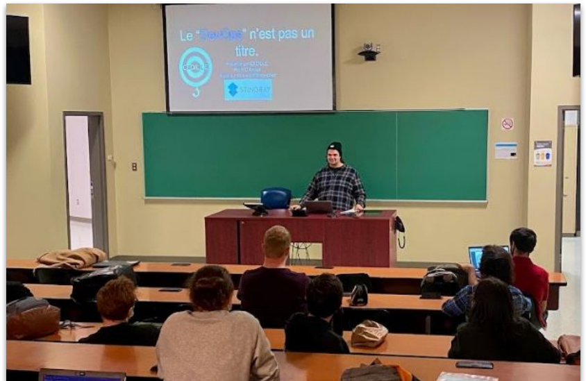
Les membres de CEDILLE lors d'une présentation sur le DevOps/SRE en 2022

Partager ses connaissances et participer activement à la communauté étudiante de l'ÉTS afin d' assurer la relève.