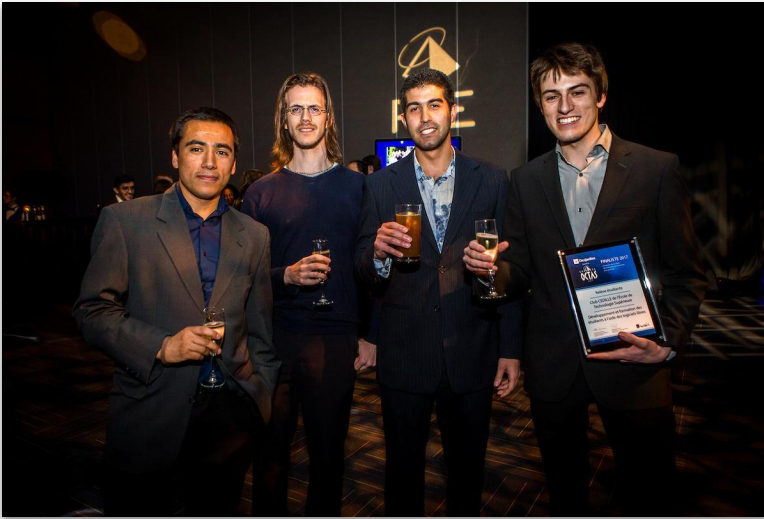
Galas OCTAS 2017 à Québec

Développer son leadership en collaborant activement sur des projets et en organisant des compétitions comme le HackQC 2018.