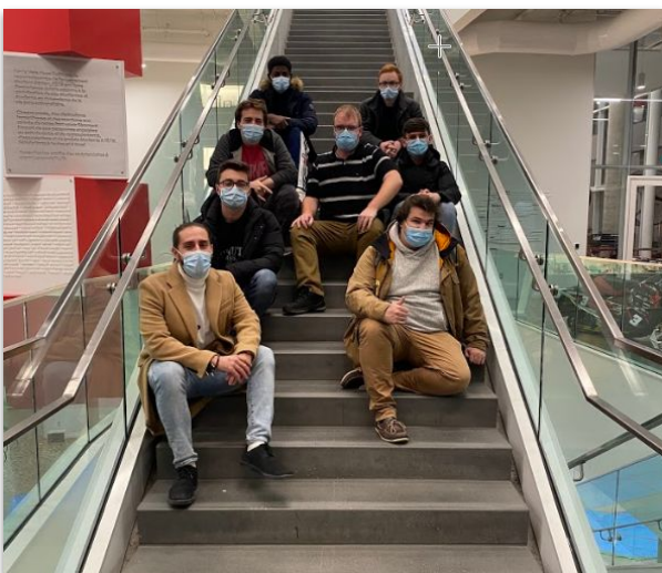
Photo des membres de CEDILLE en 2021

Avoir un impact avec des projets comme JardinIoT et nos collaborations avec d'autres comités étudiants.